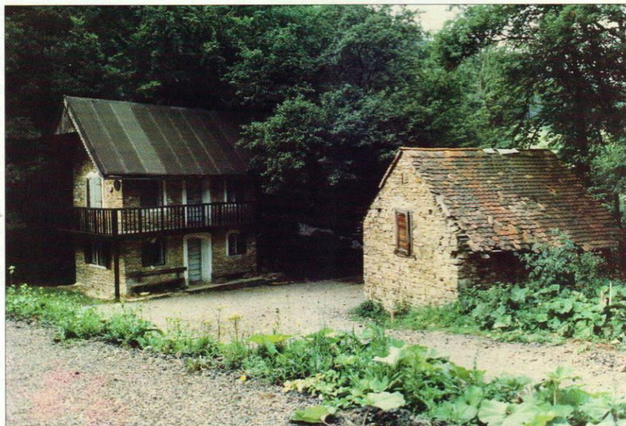
Magnisova hájovka (Megovka) ve Filipově údolí, místo setkávání Čechů a Slováků

Po roce 1882 schůzky organizovaly i Besedy v Uherském Ostrohu a Strážnici.