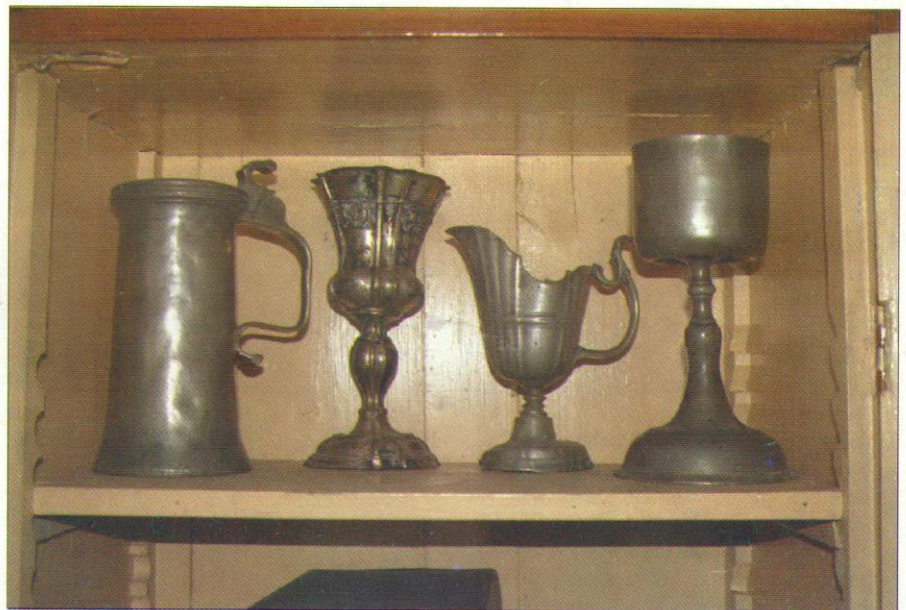
Zleva bratrská konev na víno, kalich (asi již z doby potoleranční), bratrská křestní konvička a bratrský kalich. Po dobu rekatolizace byly předměty ukryty v uherském městečku Récse v prešpurské župě. Po vydání tolerančního patentu byly převezeny zpět do Javorníka. Nyní jsou uloženy ve zdejším farním archivu.