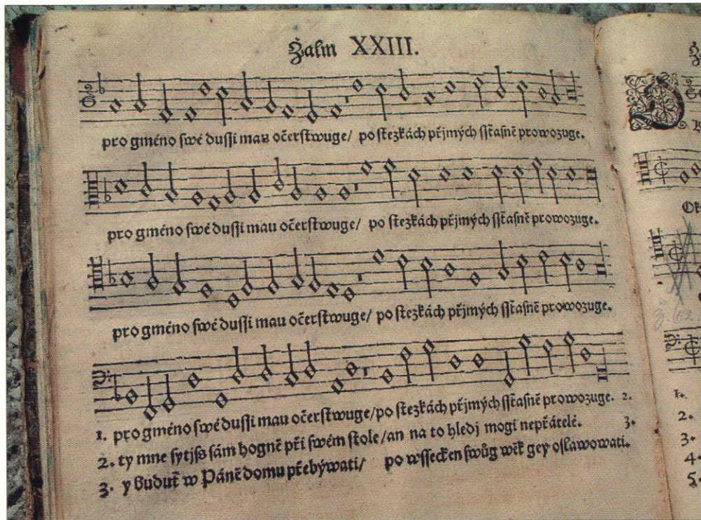
Žalm XXIII z bratrského žaltáře z 16. století, vytištěného u Daniela z Karllsperku. Obsáhlý žaltář patří mezi poslední exempláře nacházející se v Čechách a na Moravě

a dalších míst. Zajímavé ovšem je, že Morvai snad ani nemínil upozornit na stálý exodus na Slovensko. Z jeho hlášení chápeme, že mu šlo spíše o to, aby se uprchlíci vrátili zpět. Tím by se jejich počet v slovenském příhraničí snížil, a pak by mohli