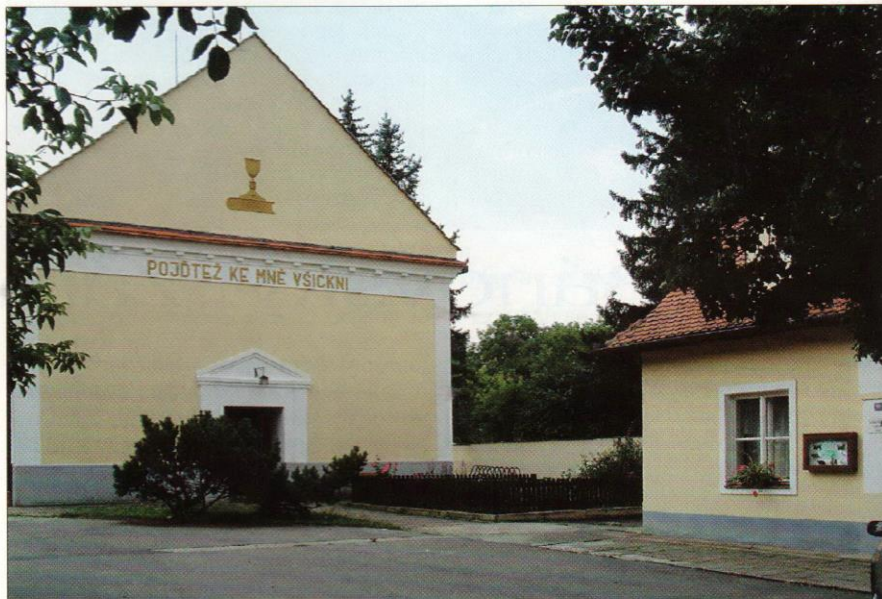
Současný evangelický kostel s farou v Javorníku

ráný kazatel, který k sobě neustále lákal moravské uprchlíky, přestože nedlouho předtím vyšly v Uhrách císařské patenty, jimiž měla být omezována moc a vliv nekatolíků tím, že jim budou odebrány kostely a školy. Hradištský děkan si přál, aby se tak stalo i v Sobotišti, Vrbovcích a Prietrži. Poukázal též na skutečnost, že Javorničtí, kteří r. 1740 uprchli do Uher, jsou pro změnu opět na Moravě, od své vrchnosti trpěni, a dokonce veřejně za pomoci kazatelů vyznávají svou sektu. Proto navrhol provést následující opatření: Předně pochytat a uvěznit všechny predikanty a vůdce. Ti žijí anebo často nacházejí útulek v osamělých mlýnech, ba často jsou kazateli sami mlynáři. Tvrdil, že v Lipově zná několik lidí, kteří se scházejí ve sváteční dny v mlýnici a tam si předčítají zakázané knihy. Podobně je tomu ve Velké, kde dvanáct evangelíků obrací jině. Největší vliv