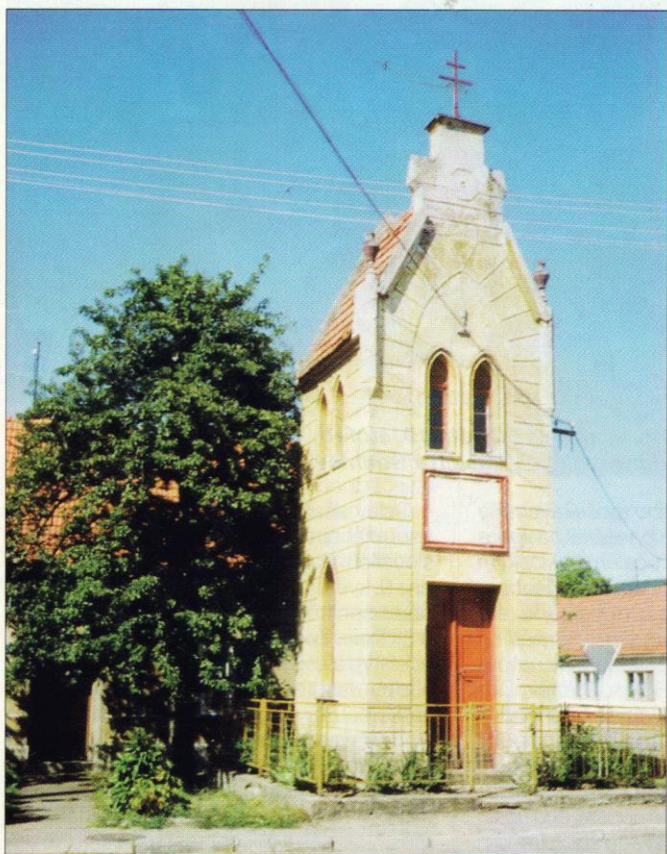
Evangelická modlitebna ve Velké nad Veličkou

trská poloulání“, a v urbáři z r. 1620, kde je dokonce uvedeno „Bratři ve zboru“. Jen na okraj připomínám, že po 100 letech, v období 1694 – 1700, kdy panství bylo už skoro sedm desetiletí v držení katolických Magnisů, je ještě uváděn „Bratrský čtvrtlán“.