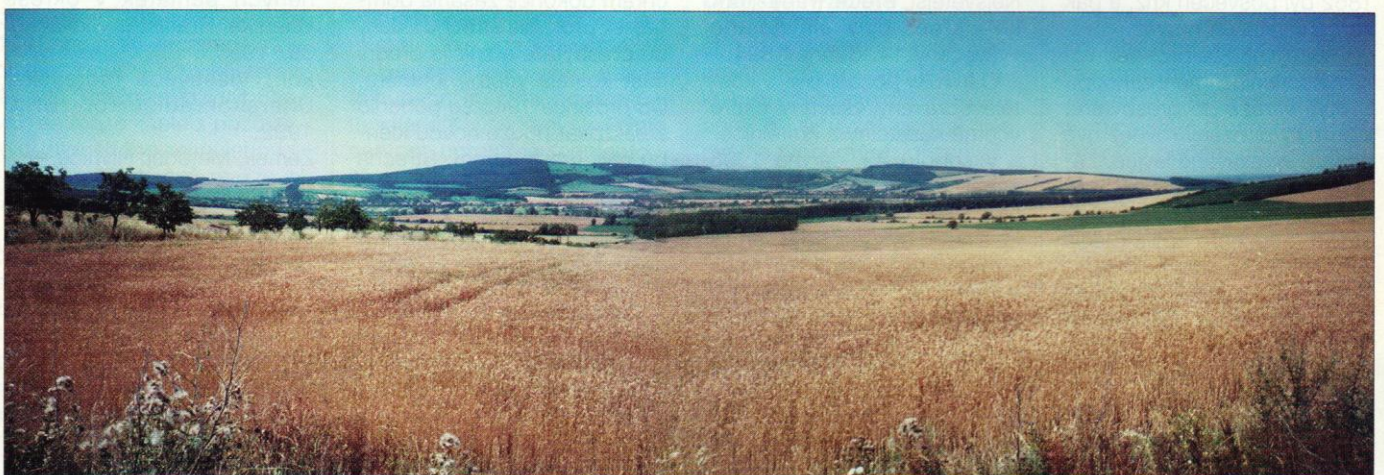
Panorama: Kuželov – Hrubá Vrbka – Malá Vrbka, pohled od východu

Další latinský zápis je z roku 1690: „Následuje seznam těch, kteří v Uhrách hříšným luteránským sňatkem byli sezdání,